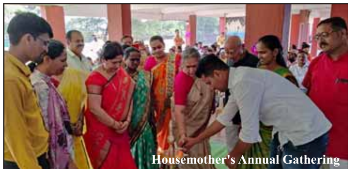
Housemother's Annual Gathering