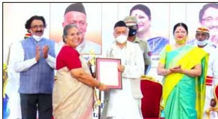
Stree Shakti National Award