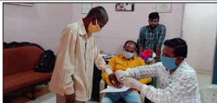
General Check-up at Ratnagiri by Government Hospital

All the children at the Ratnagiri centre were tested for HIV by government hospital workers. A general check-up was done as well. The children were guided on how to take care of themselves.