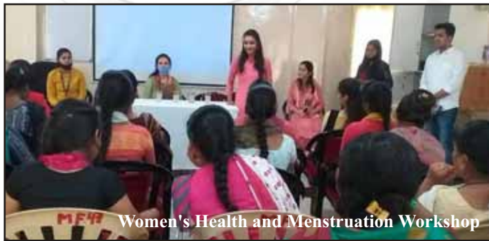
Women's Health and Menstruation Workshop

purpose, the Tata Group organized a Zumba dance which is a form of exercise. Exercise with a diet is important for our health; this was the message conveyed to the women.