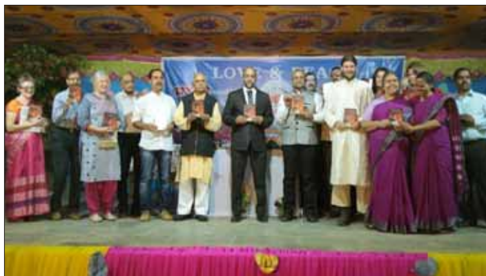
Anniversary guests releasing the CD 'Sister Heart'