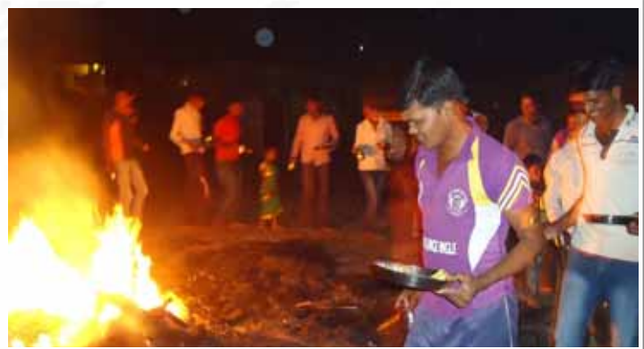
Children consign sinful feelings and thoughts to bonfire