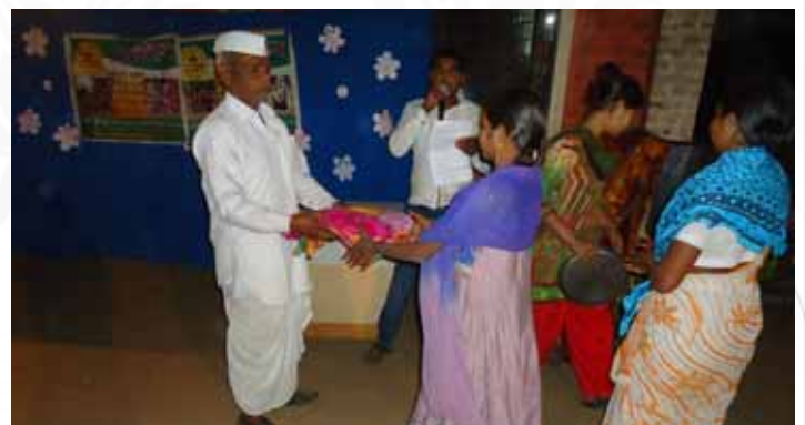
A community member receiving a sari

Thakars are one of Maharashtra's most backward tribal