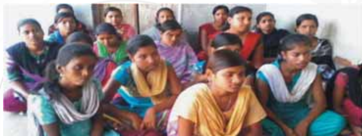
Learning new skills is the only way toward self reliance

Around 14 women participated in this competition. It was organised