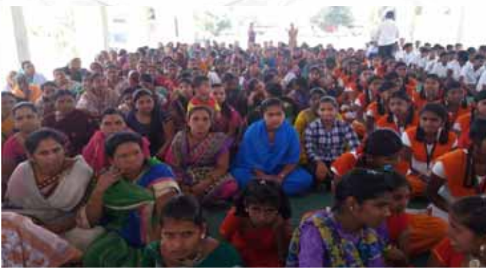
Women flock to attend the programme in a big way

As usual, International Women's Day was celebrated with enthusiasm as follows at various Maher units.