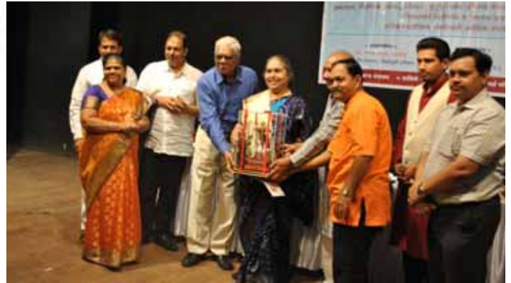
At the Dagdu Sheth Halwai Ganapati and the Shivasphurti Pratishthan Award Ceremonies