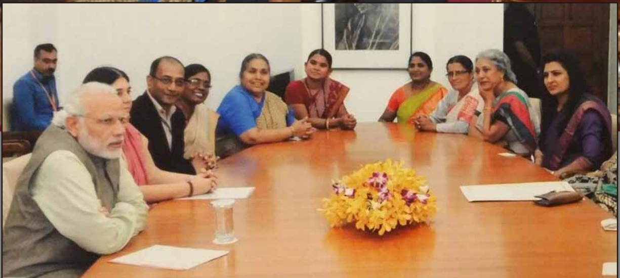
Prime Minister Narendra Modi having a word with the awardees