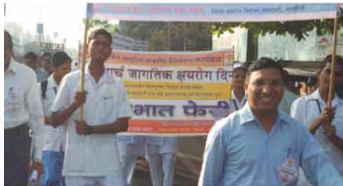
Joining the fight against tuberculosis

This day was celebrated at Maher with the participants from Ratnagiri Civil Hospital, Chay Organisation and the District Tuberculosis Centre. One of the participant doctors gave the information on the causes, symptoms and treatment of tuberculosis. This was followed by a rally from the civil hospital to Ratnagiri bus stand. The programme also featured a street play on tuberculosis by the nursing students.