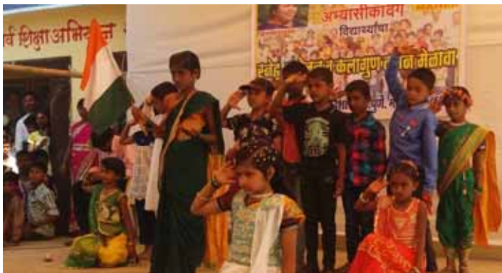
Children salute the tricolor on the Hutatma Din

A Maher Abhyasika (study centre) is a novel idea. Implemented under the Vidyalaya project, it brings together various children in local schools and provides them with extra coaching in general studies and homework, thereby dissuading them from dropping out. There are at present as many as 18 Maher study centres scattered in different villages.