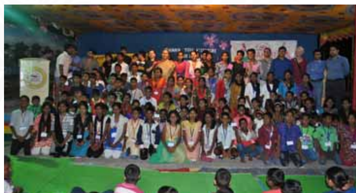
The voters pose for a photo after the formation of the cabinet