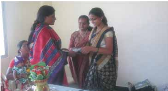
Certificates being given away for one of the courses.

Maher does not work merely as a shelter; its final aim is to rehabilitate its residents and enable them to be economically self-sufficient. Toward this aim it is now customary at Maher to organise as many training courses for women as possible. Following are the various courses organised by Maher during the last six months for women: