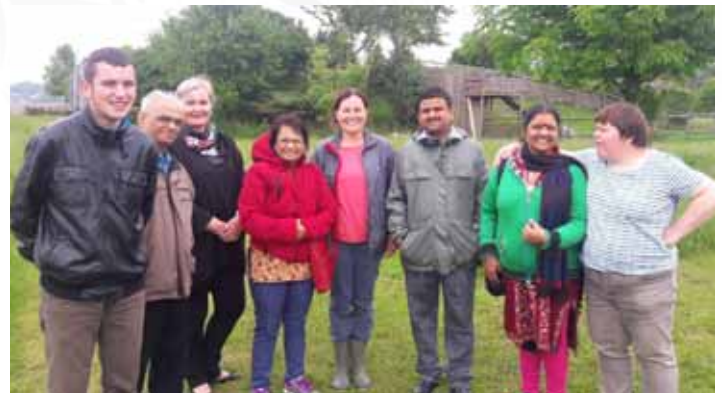
Maher delegates with Hartheim clients and volunteers between the oldage homes in India and those in a developed country like Austria.

A visit to an oldage home brought out sharply the difference